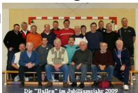
Die "Bullen" im Jubiläumsjahr 2009